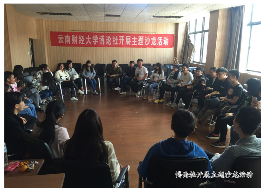
博文社开展主题沙龙活动